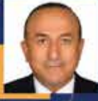
Mevlüt ÇAVUŞOĞLU Antalya 1. Sıra Milletvekili Adayı