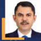
Murat KURUM İstanbul 1.Bölge 1. Sıra Milletvekili Adayı