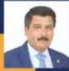
Kemal ÇELİK Antalya 4. Sıra Milletvekili Adayı