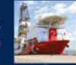
Türkiye'nin 19. Cumhurbaşkanı Erdoğan'ın Cumhurbaşkanlığı Hükümet Sistemi ile Cumhurbaşkanlığı Kurumlarının Kuruluşu ile ilgili konuşması 31 Mayıs 2018