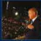
24 Haziran - Cumhurbaşkanlığı ile Hükümet'in Genel Seçimler Sonrası Birlikten Kurulması 24 Haziran 2018