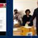
Devlet'in ilk kez AK Parti'ye girmesi 27 Nisan 2007