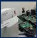
AK Parti'nin en büyük başarısı oldu 28 Aralık 2011