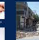
2015 Genel Seçimler Kampanyası. 7 Haziran 2015