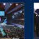
Cumhurbaşkanı Erdoğan'ın Cumhurbaşkanlığı Hükümet Sistemi ile Cumhurbaşkanlığı Kurumlarının Kuruluşu ile ilgili konuşması 16 Kasım 2021