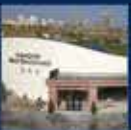
İstanbul'un En Büyük Hava Limanı, İstanbul Havalimanisi'nin 1. Etapının İnşaatına Başlanması 17 Nisan 2018