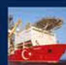
Yeni nesil Türkiye Kuvveti'nin Kurulması ile ilgili konuşması 7 Aralık 2019