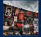
2013 yılında düzenlenen 12. yıl kutlamaları AK Parti'nin en büyük başarısı oldu 6 Haziran 2013