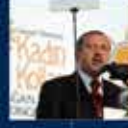
1. Okulun AK Parti Kadın Kolları Kurultayına Katılan İlk Kez 8 Mayıs 2005