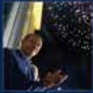
13 Ağustos Cumhurbaşkanlığı Seçimi için yapılan basın toplantısı. 13 Ağustos 2014