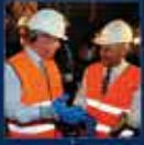
AK Parti'nin inşaatçıların en büyük başarısı oldu 9 Ekim 2009