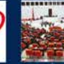
Devlet'in ilk kez AK Parti'ye girmesi 20 Nisan 2006