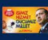
2009 Yıllık Seçimler Kampı'nın Ankara'da açılması 29 Mart 2009