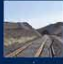
İstanbul-Hakkâri Demiryolu'nun inşaatı başladı 21 Kasım 2008