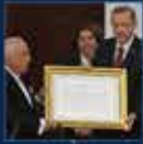
12. Cumhurbaşkanlığı Seçimi için yapılan basın toplantısı. 13 Ağustos 2014