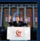
15 Temmuz'da Ankara'da yapılan toplantı. 20 Temmuz 2016