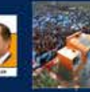
2004 Genel Seçimleri Kurultayına Katılan İlk Kez 28 Mart 2004