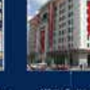
2007 Genel Seçimleri Kurultayına Katılan İlk Kez 22 Temmuz 2007