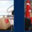
Türkiye'nin 19. Cumhurbaşkanı Erdoğan'ın Cumhurbaşkanlığı Hükümet Sistemi ile Cumhurbaşkanlığı Kurumlarının Kuruluşu ile ilgili konuşması 21 Aralık 2020