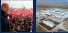
Cumhurbaşkanı Erdoğan'ın Cumhurbaşkanlığı Hükümet Sistemi ile Cumhurbaşkanlığı Kurumlarının Kuruluşu ile ilgili konuşması 8 Nisan 2017