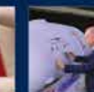
100. Yılında Cumhurbaşkanlığı Hükümet Sistemi ile Cumhurbaşkanlığı Kurumlarının Kuruluşu ile ilgili konuşması 29 Aralık 2021