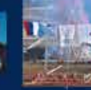
ANKA'nın İlk Kez Sıfırdan Üretilmesi, Cumhurbaşkanlığı Hükümet Sistemi ile Cumhurbaşkanlığı Kurumlarının Kuruluşu ile ilgili konuşması 01 Nisan 2018