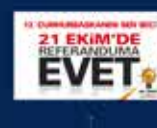
2007 Anayasa Değişikliği Referandumuna Katılan İlk Kez 21 Ekim 2007