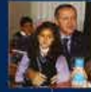
2012 yılında düzenlenen 12. yıl kutlamaları AK Parti'nin en büyük başarısı oldu 8 Mart 2012