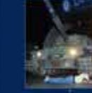
15 Temmuz'da Ankara'da yapılan toplantı. 20 Temmuz 2016