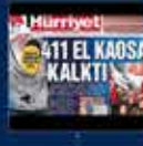
AK Parti ve MHP'nin iktidarda olmasıyla birlikte 411 el kaosu kaldırıldı 30 Eylül 2008