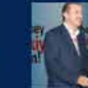
2004 Genel Seçimleri Kurultayına Katılan İlk Kez 28 Mart 2004