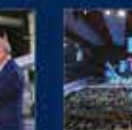
7. Olağan Kurultay 24 Mart 2021