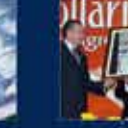
1. Okulun AK Parti Kadın Kolları Kurultayına Katılan İlk Kez 8 Mayıs 2005