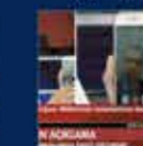
15 Temmuz'da Ankara'da yapılan toplantı. 20 Temmuz 2016