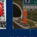
2007 Genel Seçimleri Kurultayına Katılan İlk Kez 22 Temmuz 2007