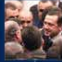
Recep Tayyip Erdoğan'ın Cumhurbaşkanlığına seçildiği anı 28 Mayıs 2003