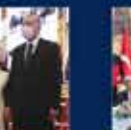
Cumhurbaşkanı Erdoğan'ın Cumhurbaşkanlığı Hükümet Sistemi ile Cumhurbaşkanlığı Kurumlarının Kuruluşu ile ilgili konuşması 22 Temmuz 2022