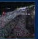
15 Temmuz'da Ankara'da yapılan toplantı. 20 Temmuz 2016