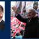
15 Temmuz'da Ankara'da yapılan toplantı. 20 Temmuz 2016