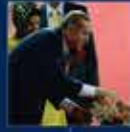
4 Ocak'ta yapılan seçimlerin en büyük başarısı oldu 30 Eylül 2012