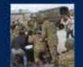
2014 Yıllık Seçimler Kampı'nın Ankara'da açılması 19 Ocak 2014