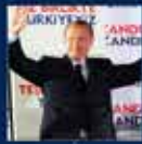
2011 Genel Seçimler Kampı'nın Ankara'da açılması 12 Haziran 2011