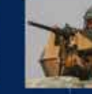
15 Temmuz'da Ankara'da yapılan toplantı. 20 Temmuz 2016