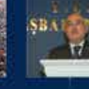
2007 Genel Seçimleri Kurultayına Katılan İlk Kez 22 Temmuz 2007