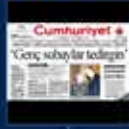
Recep Tayyip Erdoğan'ın Cumhurbaşkanlığına seçildiği anı 28 Mayıs 2003