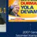
2007 Genel Seçimleri Kurultayına Katılan İlk Kez 22 Temmuz 2007