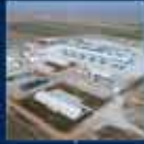
19. Cumhurbaşkanı Erdoğan'ın Cumhurbaşkanlığı Hükümet Sistemi ile Cumhurbaşkanlığı Kurumlarının Kuruluşu ile ilgili konuşması 19 Nisan 2017