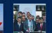
Cumhurbaşkanı Recep Tayyip Erdoğan'ın 100. Doğum Günü ile ilgili konuşması 4 Aralık 2019