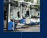
2013 yılında düzenlenen 12. yıl kutlamaları AK Parti'nin en büyük başarısı oldu 27 Mayıs 2013