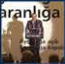
AK Parti Tanıtımı ve Kurultayı 14 Aralık 2001