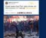
2013 yılında düzenlenen 12. yıl kutlamaları AK Parti'nin en büyük başarısı oldu 29 Mayıs 2013