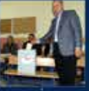
2010 Anayasa Değişikliği Hakkında Oylama'nın en büyük başarısı oldu 12 Eylül 2010