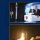
100. Yılında Cumhurbaşkanlığı Hükümet Sistemi ile Cumhurbaşkanlığı Kurumlarının Kuruluşu ile ilgili konuşması 18 Haziran 2022