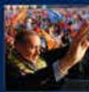
2009 Yıllık Seçimler Kampı'nın Ankara'da açılması 21 Mart 2009