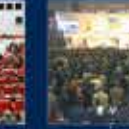
2. Okulun AK Parti Kadın Kolları Kurultayına Katılan İlk Kez 11 Kasım 2006