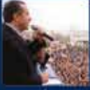
Recep Tayyip Erdoğan'ın Kahramanmaraş'ta yaptığı konuşma 8 Aralık 2001