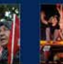
15 Temmuz'da Ankara'da yapılan toplantı. 20 Temmuz 2016