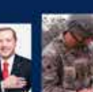
Cumhurbaşkanı Erdoğan'ın Cumhurbaşkanlığı Hükümet Sistemi ile Cumhurbaşkanlığı Kurumlarının Kuruluşu ile ilgili konuşması 9 Ekim 2018