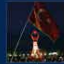
15 Temmuz'da Ankara'da yapılan toplantı. 20 Temmuz 2016