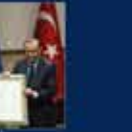
15 Temmuz'da Ankara'da yapılan toplantı. 20 Temmuz 2016