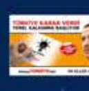
2004 Genel Seçimleri Kurultayına Katılan İlk Kez 28 Mart 2004