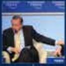
Muhtarların en büyük başarısı oldu 29 Ocak 2009