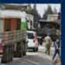
2014 Yıllık Seçimler Kampı'nın Ankara'da açılması 18 Ocak 2014