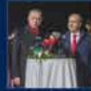
Cumhurbaşkanı Erdoğan'ın Cumhurbaşkanlığı Hükümet Sistemi ile Cumhurbaşkanlığı Kurumlarının Kuruluşu ile ilgili konuşması 8 Ekim 2020