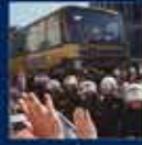
Recep Tayyip Erdoğan'ın emekli askerlerin için yaptığı konuşma 28 Mart 1998