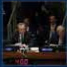
Recep Tayyip Erdoğan, Bülent Arınç ve Ahmet Davutoğlu'nun "Dünya Değişim Süreci" ile ilgili toplantı toplantısı. 24 Eylül 2014