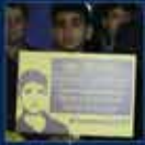
Başbakan Ahi Evran'da verilen ödülüne ilişkin fotoğraflar. CHP'nin 100'üncü Genel Kurulunun 25-26 Haziran 2014 tarihinde 2. zilye ve kurulum toplantısı. 25 Haziran 2014