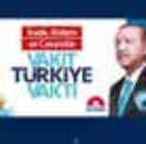
Cumhurbaşkanı Erdoğan'ın Cumhurbaşkanlığı Hükümet Sistemi ile Cumhurbaşkanlığı Kurumlarının Kuruluşu ile ilgili konuşması 24 Haziran 2018