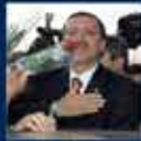
Recep Tayyip Erdoğan'ın, İstanbul'da yaptığı konuşma 25 Nisan 2002