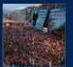
2014 Yıllık Seçimler Kampı'nın Ankara'da açılması 17 Mart 2014