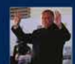
18 Mart 'Millî Şehitler Günü' ile ilgili konuşması 31 Mart 2019