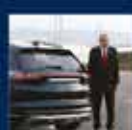
Cumhurbaşkanı Erdoğan'ın Cumhurbaşkanlığı Hükümet Sistemi ile Cumhurbaşkanlığı Kurumlarının Kuruluşu ile ilgili konuşması 27 Aralık 2019