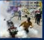
2013 yılında düzenlenen 12. yıl kutlamaları AK Parti'nin en büyük başarısı oldu 27 Mayıs 2013