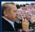
2011 Genel Seçimler Kampı'nın Ankara'da açılması 11 Haziran 2011