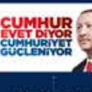
15 Temmuz'da Ankara'da yapılan toplantı. 20 Temmuz 2016