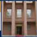
Erdoğan ve Şişli'deki ilk konuşması 11 Eylül 2002