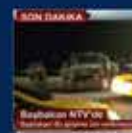
15 Temmuz'da Ankara'da yapılan toplantı. 20 Temmuz 2016