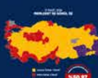
Türkiye'nin 19. Cumhurbaşkanı Erdoğan'ın Cumhurbaşkanlığı Hükümet Sistemi ile Cumhurbaşkanlığı Kurumlarının Kuruluşu ile ilgili konuşması 14 Ocak 2018