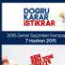
2015 Genel Seçimler Kampanyası. 7 Haziran 2015