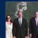
Cumhurbaşkanı Erdoğan'ın Cumhurbaşkanlığı Hükümet Sistemi ile Cumhurbaşkanlığı Kurumlarının Kuruluşu ile ilgili konuşması 15 Haziran 2021