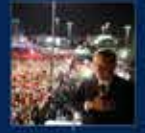
2013 yılında düzenlenen 12. yıl kutlamaları AK Parti'nin en büyük başarısı oldu 7 Haziran 2013