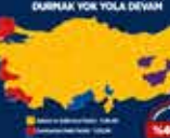
2007 Genel Seçimleri Kurultayına Katılan İlk Kez 22 Temmuz 2007