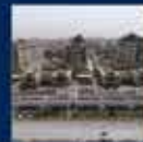
İstanbul'un En Büyük Hava Limanı, İstanbul Havalimanisi'nin 1. Etapının İnşaatına Başlanması 21 Mayıs 2020