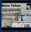
Recep Tayyip Erdoğan'ın ilk kez basın karşısına çıktığı anı 24 Eylül 1998