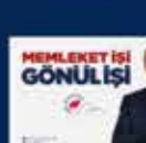
18 Mart 'Millî Şehitler Günü' ile ilgili konuşması 31 Mart 2019