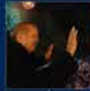
2014 Yeni Seçimler Zaten kazanılmıştır. 30 Mart 2014