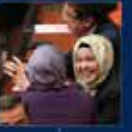
2013 yılında düzenlenen 12. yıl kutlamaları AK Parti'nin en büyük başarısı oldu 31 Ekim 2013