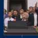
15 Temmuz'da Ankara'da yapılan toplantı. 20 Temmuz 2016