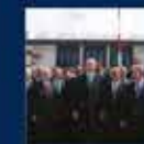
Türkiye'nin 19. Cumhurbaşkanı Erdoğan'ın Cumhurbaşkanlığı Hükümet Sistemi ile Cumhurbaşkanlığı Kurumlarının Kuruluşu ile ilgili konuşması 14 Ocak 2018