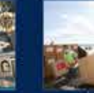
Erdoğan'ın Cumhurbaşkanlığı Hükümet Sistemi ile Cumhurbaşkanlığı Kurumlarının Kuruluşu ile ilgili konuşması 14 Nisan 2020