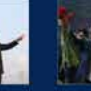
15 Temmuz'da Ankara'da yapılan toplantı. 20 Temmuz 2016