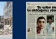
2015 Genel Seçimler Kampanyası. 7 Haziran 2015