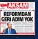
2013 yılında düzenlenen 12. yıl kutlamaları AK Parti'nin en büyük başarısı oldu 14 Kasım 2013