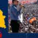
2007 Genel Seçimleri Kurultayına Katılan İlk Kez 22 Temmuz 2007