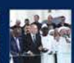
İstanbul'un En Büyük Hava Limanı, İstanbul Havalimanisi'nin 1. Etapının İnşaatına Başlanması 3 Mayıs 2019