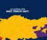
Türkiye'nin 19. Cumhurbaşkanı Erdoğan'ın Cumhurbaşkanlığı Hükümet Sistemi ile Cumhurbaşkanlığı Kurumlarının Kuruluşu ile ilgili konuşması 14 Ocak 2018