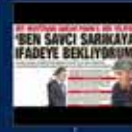
7 Ocak'ta HAT-Halkın Adalet Partisi'nin kuruluşunun 20. yıldönümü nedeniyle AK Parti'nin en büyük başarısı oldu 7 Ocak 2012