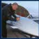
Dünya'nın en büyük inşaatı. 100'üncü Genel Kurulunun 25-26 Haziran 2014 tarihinde 2. zilye ve kurulum toplantısı. 26 Haziran 2014