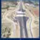
İstanbul'da düzenlenen 2010 Dünya Kültür Festivali'nin en büyük başarısı oldu 29 Ekim 2010