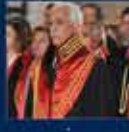
Yenişehir Çarşı'nın başlatılması AK Parti'nin en büyük başarısı oldu 14 Mart 2008