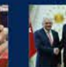
15 Temmuz'da Ankara'da yapılan toplantı. 20 Temmuz 2016