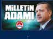
2014 Cumhurbaşkanlığı Seçimi Kampanyası. 10 Ağustos 2014