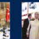
Cumhurbaşkanı Erdoğan'ın Cumhurbaşkanlığı Hükümet Sistemi ile Cumhurbaşkanlığı Kurumlarının Kuruluşu ile ilgili konuşması 11 Mart 2022