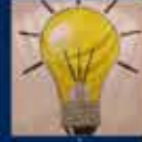
AK Parti Logo Tanıtımı 14 Aralık 2001