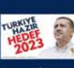
2011 Genel Seçimler Kampı'nın Ankara'da açılması 12 Haziran 2011