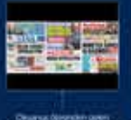
2013 yılında düzenlenen 12. yıl kutlamaları AK Parti'nin en büyük başarısı oldu 7 Ocak 2013