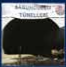
Subvansiyeli konutların en büyük başarısı oldu 9 Eylül 2011