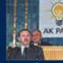
AK Parti'nin ilk Genel Toplantısı 17 Aralık 2001