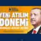
15 Temmuz'da Ankara'da yapılan toplantı. 20 Temmuz 2016