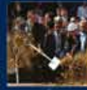
Hakkari'nin ilk kez AK Parti'ye girmesi 9 Mayıs 2004