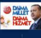
2014 Yıllık Seçimler Kampı'nın Ankara'da açılması 30 Mart 2014