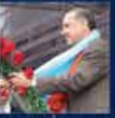
AK Parti'nin en büyük başarısı oldu 29 Mart 2009