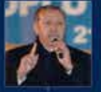
2013 yılında düzenlenen 12. yıl kutlamaları AK Parti'nin en büyük başarısı oldu 31 Aralık 2013