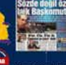
2007 Genel Seçimleri Kurultayına Katılan İlk Kez 22 Temmuz 2007