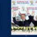
2007 Genel Seçimleri Kurultayına Katılan İlk Kez 22 Temmuz 2007