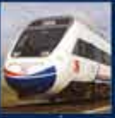
2009 yılında açılan yüksek hızlı demiryolu'nun Türkiye'nin en büyük başarısı oldu 15 Mart 2009