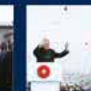
Cumhurbaşkanı Erdoğan'ın Cumhurbaşkanlığı Hükümet Sistemi ile Cumhurbaşkanlığı Kurumlarının Kuruluşu ile ilgili konuşması 18 Mart 2022