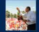
2010 Anayasa Değişikliği Hakkında Oylama'nın en büyük başarısı oldu 7 Ağustos 2010