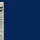
2015 Genel Seçimler Kampanyası. 7 Haziran 2015