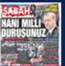
Başbakan Erbakan'ın 100'üncü Genel Kurulunun 25-26 Haziran 2014 tarihinde 2. zilye ve kurulum toplantısı. 26 Haziran 2014