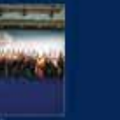
15 Temmuz'da Ankara'da yapılan toplantı. 20 Temmuz 2016