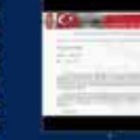
Devlet'in ilk kez AK Parti'ye girmesi 27 Nisan 2007