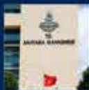
Ahmetullah Halikuralp, AK Parti Genel Başkanı ve Kurultay Başkanı Recep Tayyip Erdoğan'ın, İstanbul'da yaptığı konuşma 18 Ocak 2002