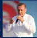
Cumhurbaşkanlığı Seçimi Kampanyası. 10 Ağustos 2014