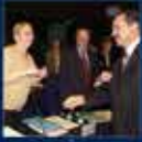
AK Parti Genel Başkanı Recep Tayyip Erdoğan'ın, Dışişleri Bakanlığı'nda yaptığı konuşma 21 Kasım 2002