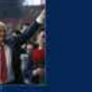
15 Temmuz'da Ankara'da yapılan toplantı. 20 Temmuz 2016