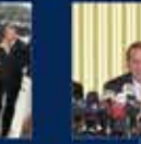
Recep Tayyip Erdoğan'ın Cumhurbaşkanlığına seçildiği anı 28 Mayıs 2004