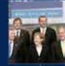
Türkiye'nin ilk kez AK Parti'ye girmesi 29 Kasım 2006