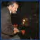
2002 Genel Seçimleri, seçim sonuçları ve ballottan konuşması 3 Kasım 2002