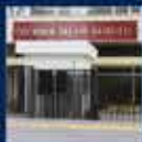
1994, AK Parti Genel Başkanı Recep Tayyip Erdoğan'ın, İstanbul'da yaptığı konuşma 18 Eylül 2002