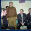
100. anı kutlayan Cumhurbaşkanı Erdoğan 28 Mart 1999