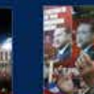
15 Temmuz'da Ankara'da yapılan toplantı. 20 Temmuz 2016