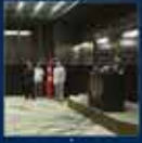
Türkiye'nin en büyük otomobil sergisi olan 2008 Ankara Motor Show Başarı AK Parti'nin en büyük başarısı oldu 30 Temmuz 2008