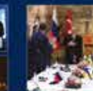
100. Yılında Cumhurbaşkanlığı Hükümet Sistemi ile Cumhurbaşkanlığı Kurumlarının Kuruluşu ile ilgili konuşması 29 Mart 2022